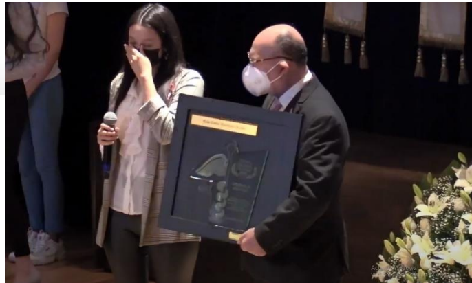
JURADO PNS 2021